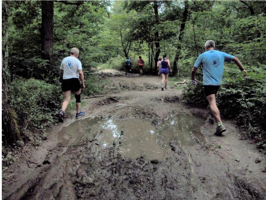
quelques jolies flaques ...