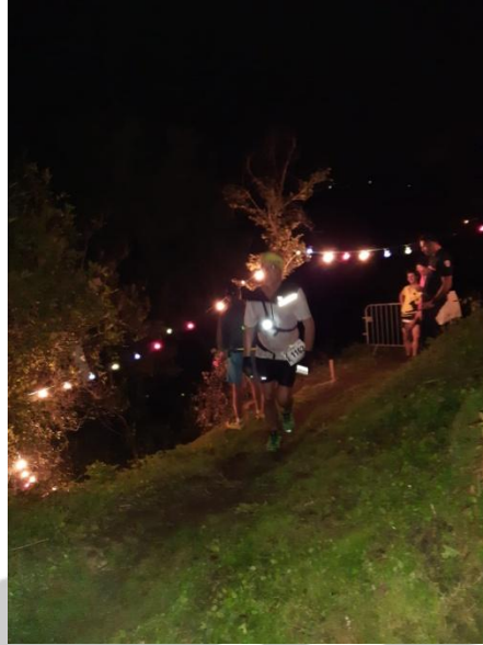
Pascalou à quelques mètres de l'arrivée...

Autant dire que ça ne s'est pas fini au sprint !